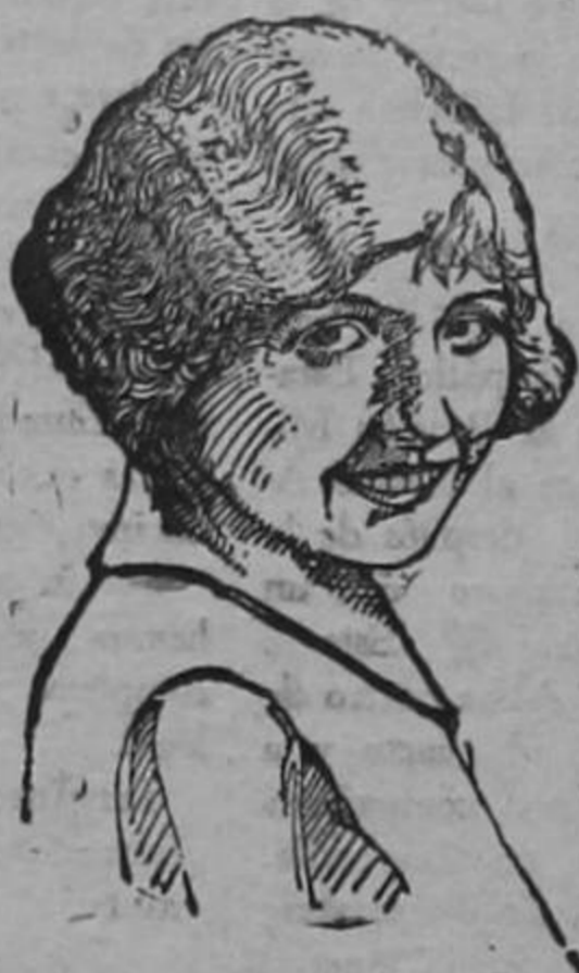
La Estrella del Cine: Señora EVA NOVAK Dice: Desde que empecé a usar la PASTA DENTIFICA

lico. Versará ésta sobre las Doctrinas de Drago — América para la Humanidad — y la de Monroe — América para los yanquis. — Es sugestivo el tema.