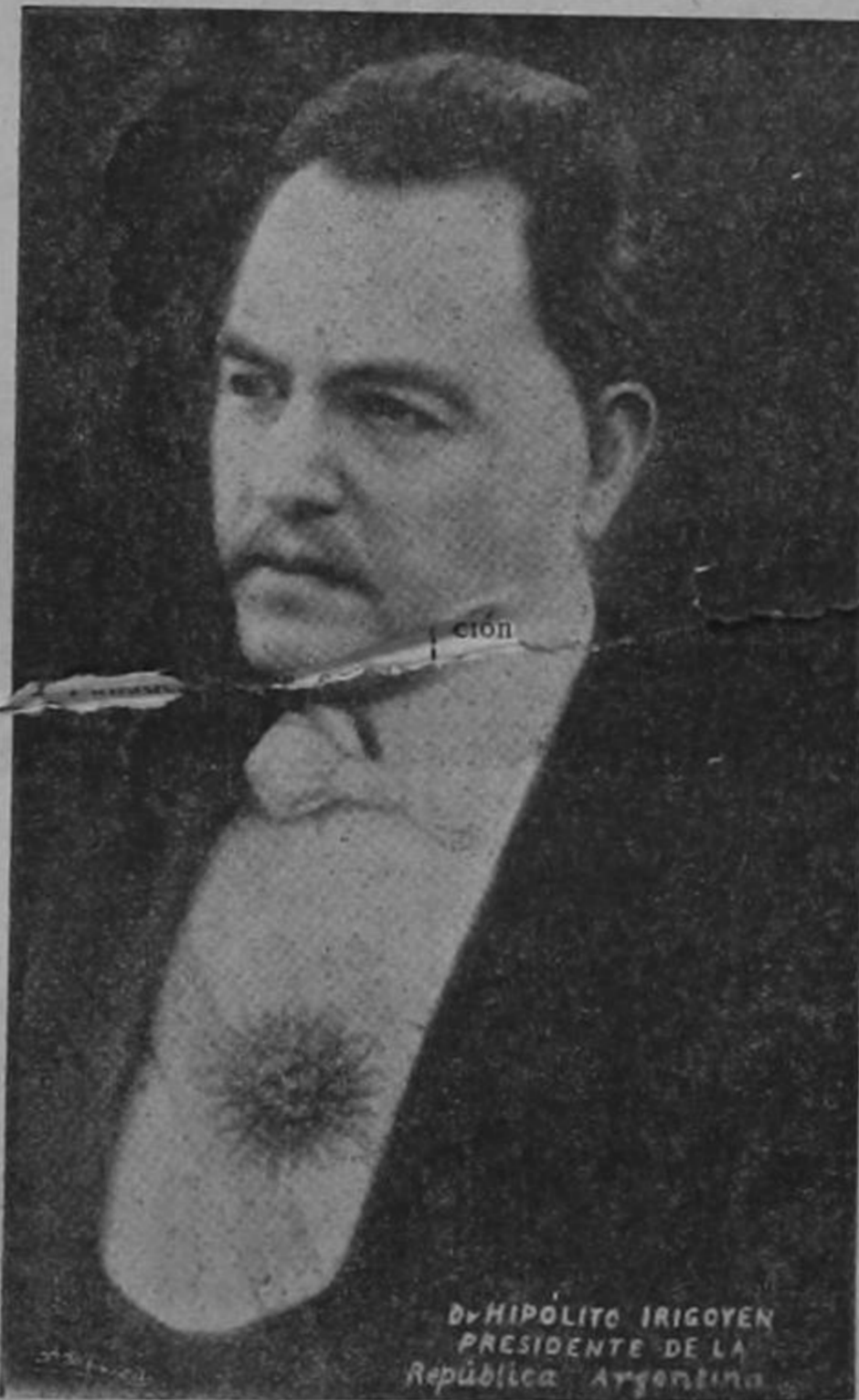
Dr. HIPOLITO YRIGOYEN PRESIDENTE DE LA REPUBLICA ARGENTINA

Nos complacemos en engalanar nuestras páginas con un retrato del Primer Mandatario de la República Argentina, el doctor don Hipólito Yrigoyen, que después de un período constitucional, asume de nuevo el mando de la nación, consagrado por el voto de sus conciudadanos en una lucha intensa y apasionada y con una mayoría aplastadora como no se registra en los anales de la vida política argentina.