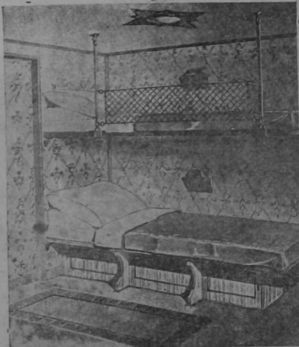
Un dormitorio del Graf Zeppelin. Un verdadero alarde de refinamiento y comodidad. Estilo idéntico al mejor camarote de gran trasatlántico.

Nueva York, 3 y 55 p. m. —El Zeppelin aparece con dirección aparente de no pasar por esta ciudad. Se presume que va a dirigirse directamente a Lakehurst.